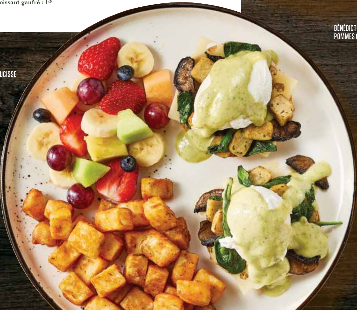
BÉNÉDICTINE SAUCISSE DE POULET B&F