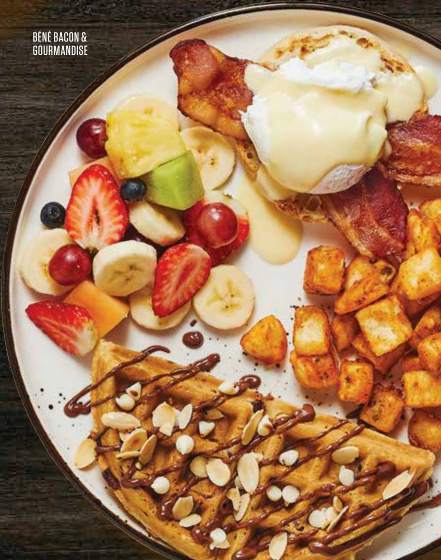
BÉNÉ BACON & GOURMANDISE

Nouveauté AVOCAT ET CRÊPE BANANES & CHOCO 19 45 Œuf poché, muffin anglais, bacon, avocat et sauce hollandaise, accompagné d'une crêpe aux bananes et chocolat aux noisettes