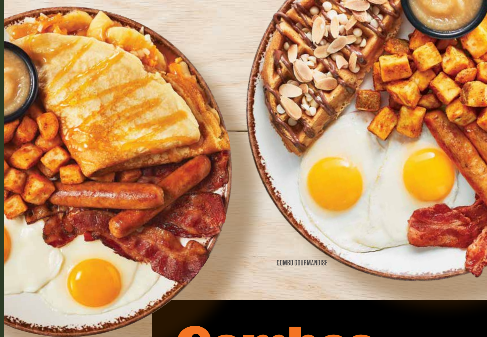
COMBO CRÊPE POMMES

Smoothie à base de fruits lyophilisés, rempli de vitamines et d'antioxydants (à l'exception du smoothie matcha & coco) procurant un boost d'énergie