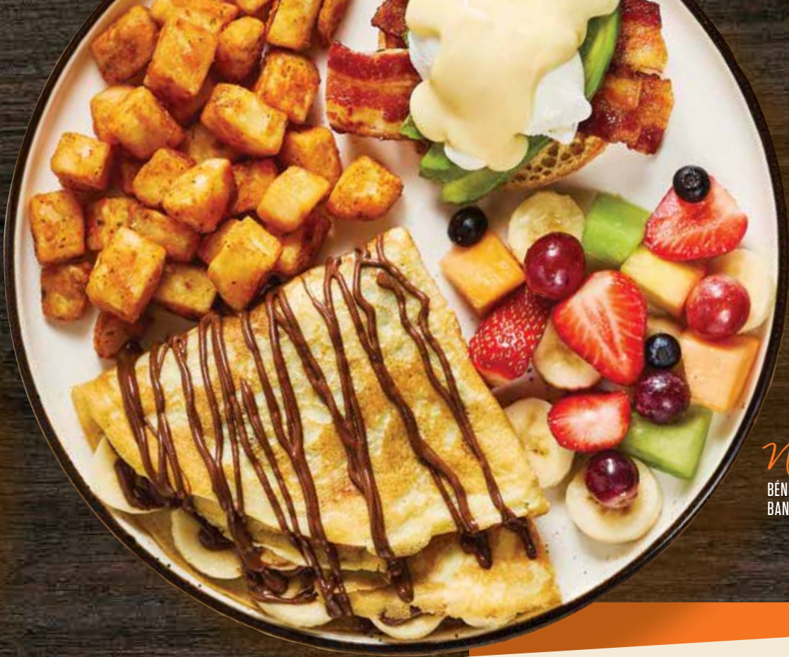
Nouveauté BÉNÉ AVOCAT ET CRÊPE BANANES & CHOCO