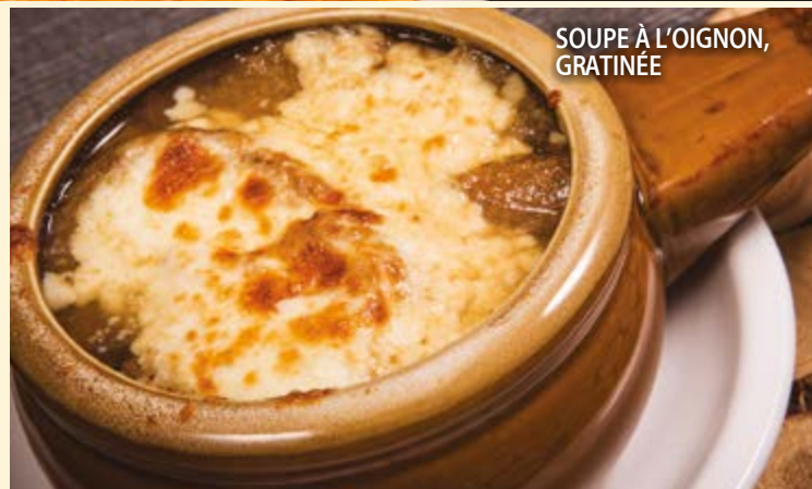
SOUPE À L'OIGNON, GRATINÉE