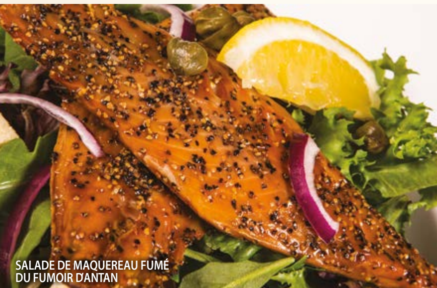
SALADE DE MAQUEREAU FUMÉ DU FUMOIR D'ANTAN

SALADE THAÏE AU POULET 24.95 (poitrine de poulet badigeonnée d'une sauce thaïe sucrée-épicée, servie sur un lit de laitue saisonnière, avec poivrons rouges, oignons rouges et bâtonnets de nouilles frites)