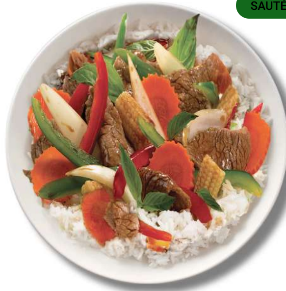
BASILIC THAÏ SAUTÉ ( HTTPS://THAIEXPRESS.CA/FR/ )