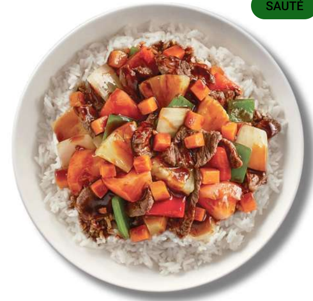
AIGRE-DOUX SAUTÉ ( HTTPS://THAIEXPRESS.CA/FR/ )