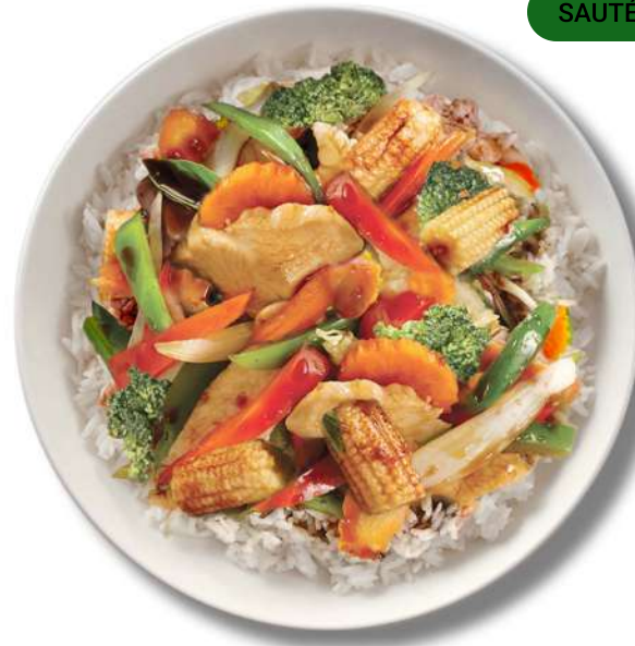
SOYA À L'AIL SAUTÉ ( HTTPS://THAIEXPRESS.CA/FR/ )