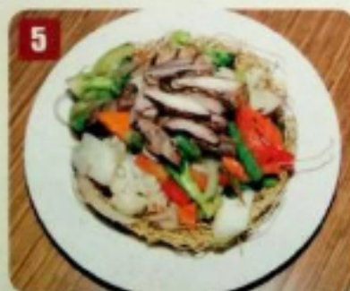
5 Poulet et légumes 9.95 Chicken and vegetables