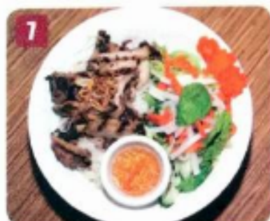
7 Poulet grillé et salad 8.95 Grilled chicken with salad