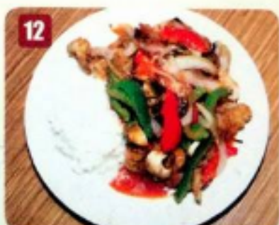
12 Poulet général Tao 8.95 General tao chicken