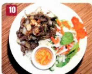
10 Boeuf sauté à la citronnelle 10.95 Stir-fried lemongrass beef