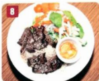
8 Boeuf grillé et salad 9.95 Grilled beef with salad