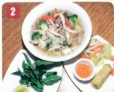
2 Tonkinoise au poulet 9.50 Tonkinese soup with chicken