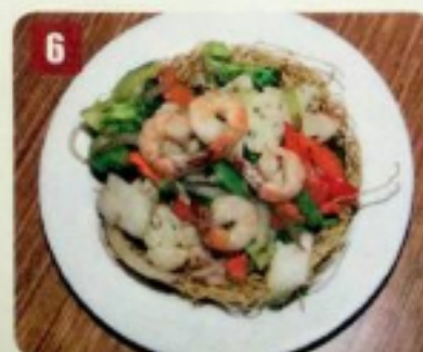
6 Crevettes et légumes 10.95 Shrimps and vegetables