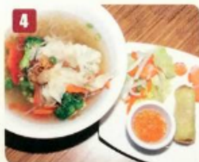
4 Wonton aux légumes 9.50 Vegetable wonton soup