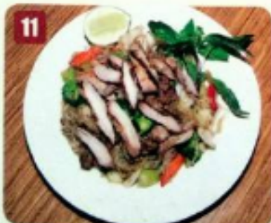
11 PadThai Vietnamien au poulet 9.95 Vietnamese PadThai with chicken