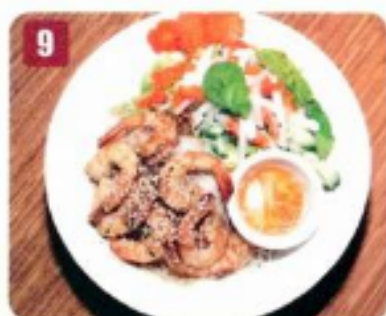
9 Crevettes grillé et salad 12.95 Grilled shrimps with salad