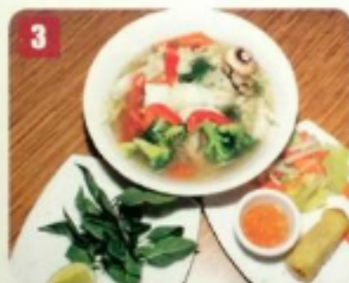
3 Tonkinoise au légumes 8.50 Tonkinese soup with vegetable