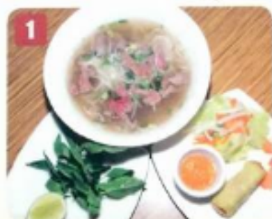
1 Tonkinoise au boeuf 9.50 Tonkinese soup with beef

*All meal soups are served with one imperial roll