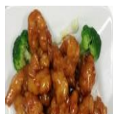
Table d'hôte du midi / Lunch Table D'hôte

Breaded chicken tossed in a sweet and sour General Tao sauce, typically includes red peppers, onions, and sesame seeds, served over rice.