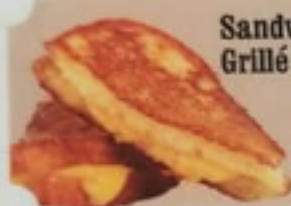
Sandwich Fromage Grillé 3 95