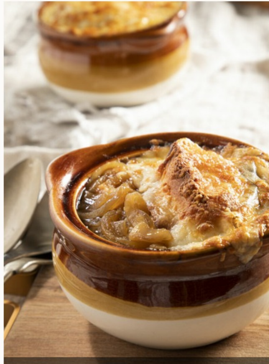
Soupe à l'oignon gratinée

Ailes de poulet Choix de sauces: Ranch à la Brise du lac, Buffalo, BBQ à la Chipie 8 ailes 21 16 ailes 31