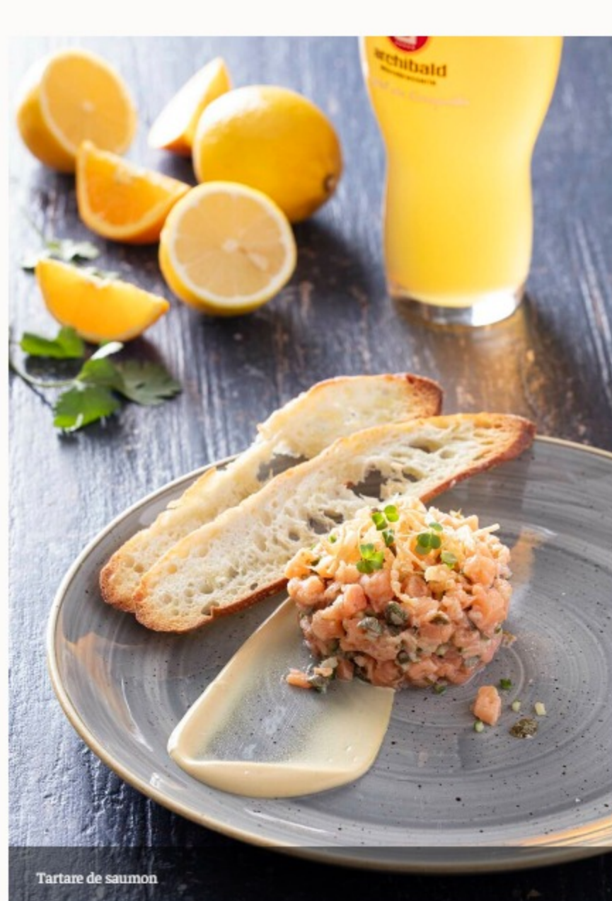
Tartare de saumon

Salade au satay de saumon 28 Sauce teriyaki, salade de légumes croquants, vinaigrette érable, sésame et Jouffue, oignons croustillants, coriandre