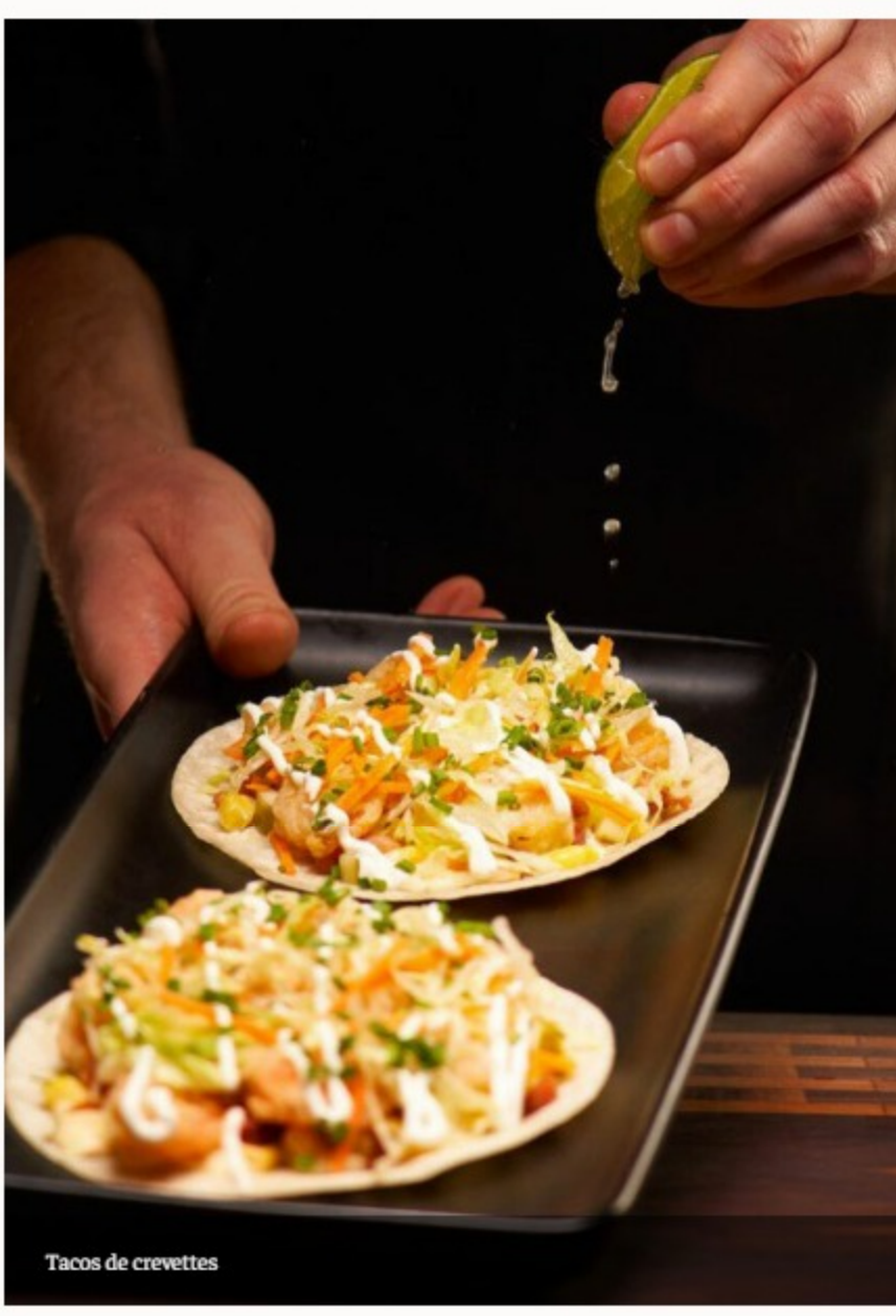
Tacos de crevettes