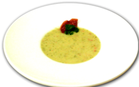
- Potage aux courgettes -