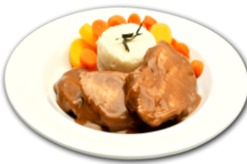
- Poulet à l'orange -