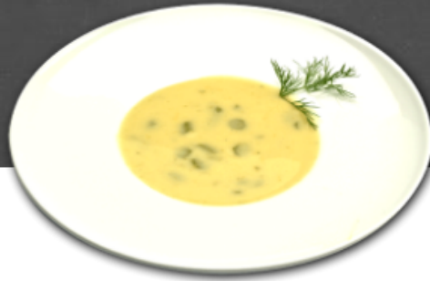
- Crème d'asperges -