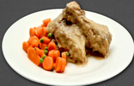
- Poulet miel et moutarde -