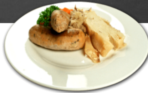
- Saucisses douces grillées -