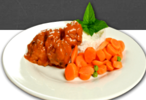
- Boulettes piquantes au cari -