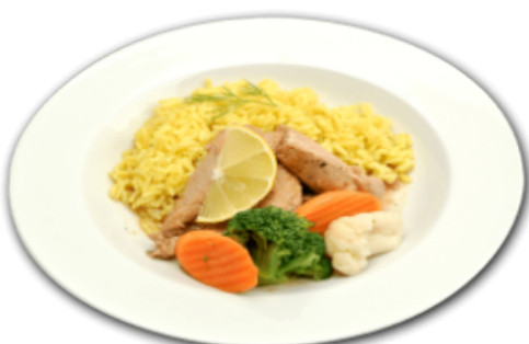
- Poulet au citron -