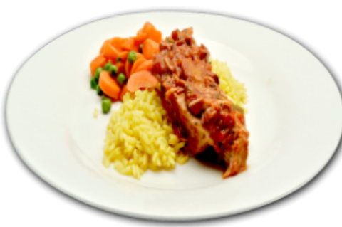
- Poulet basquaise -