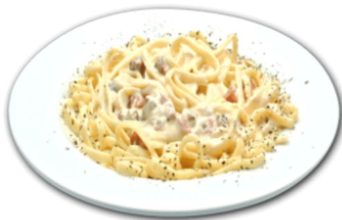
- Fettucine alfredo -