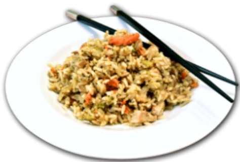
- Riz sauté au poulet -