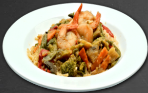
- Crevettes à l'orientale -