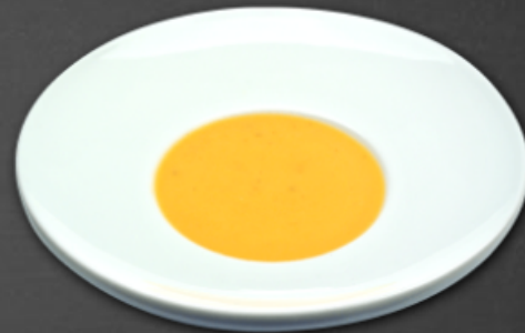
- Potage Crécy -