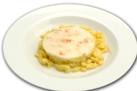
- Macaroni au fromage -