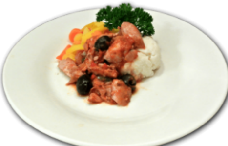
- Poulet aux olives -