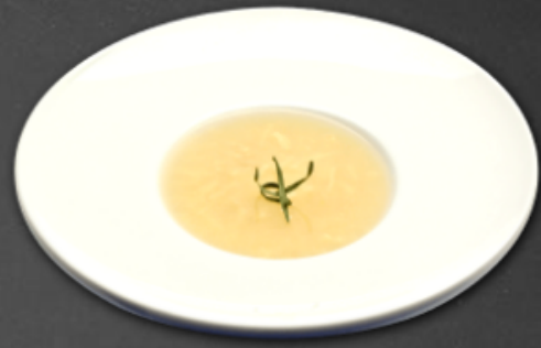
- Soupe poulet et nouilles -