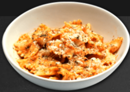
- Farfalles sauce rosées -