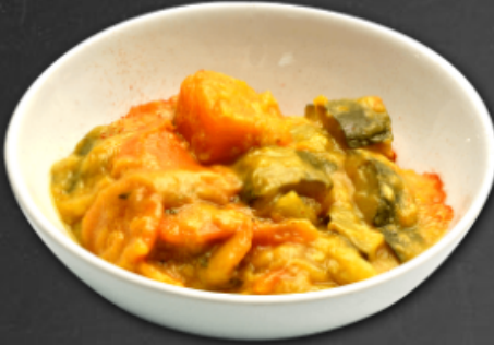
- Curry de courges -