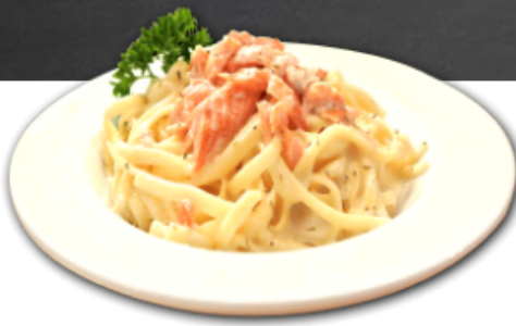
- Linguine au saumon fumé -