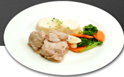
- Ragout de pâtes et boulettes -