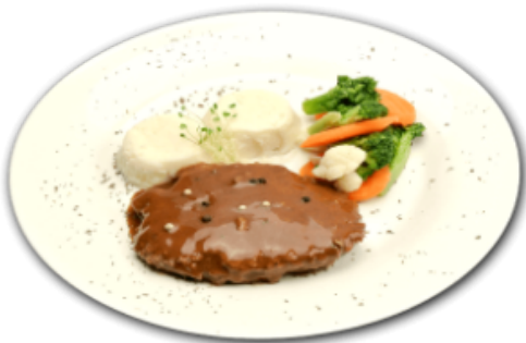
- Steak haché sauce au poivron -