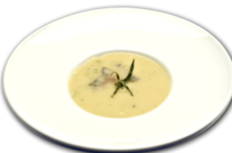
- Crème de champignons -