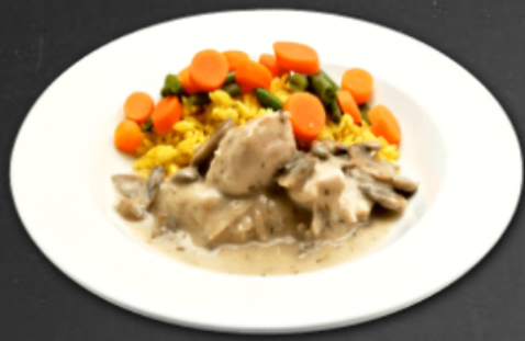
- Poulet forestière -