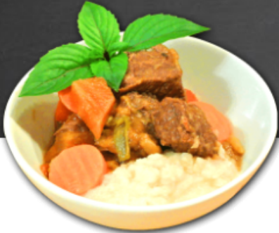
- Bœuf aux légumes -