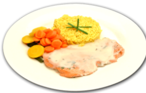
- Pavé de saumon -