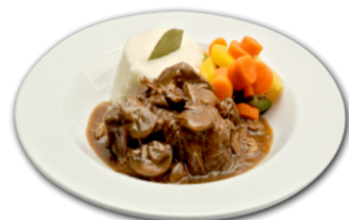
- Bœuf bourguignon -