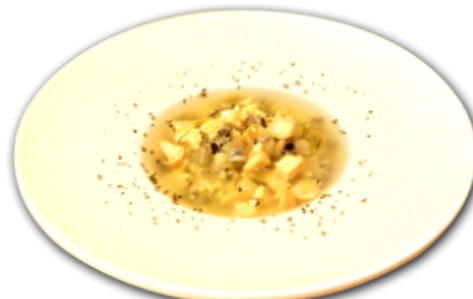
- Soupe au riz sauvage -