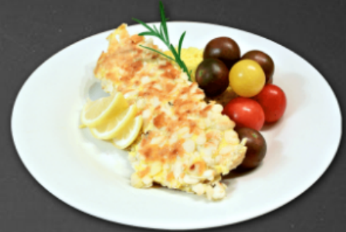
- Filet de sole amandine -