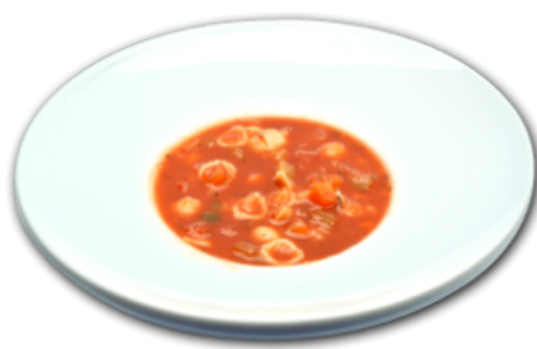
- Soupe minestrone -