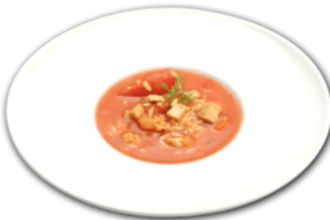
- Soupe riz et poulet -