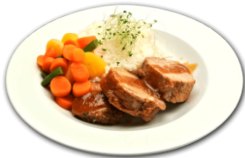
- Médillon de porc -