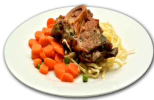
- Osso Buco -