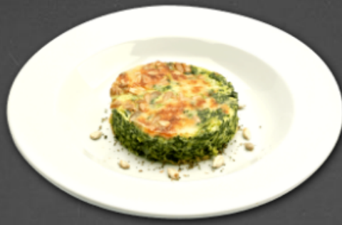
- Flan aux épinards -