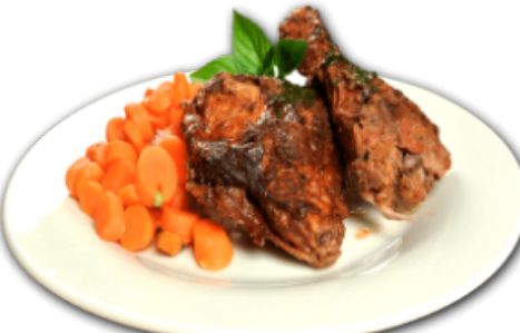
- Poulet tandori -