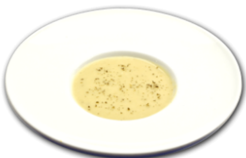
- Crème de poireaux -