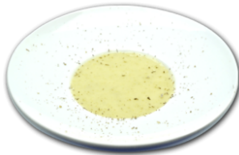
- Crèmes de brocolis -