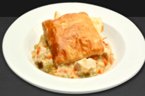
- Feuilleté de blanc de poulet -