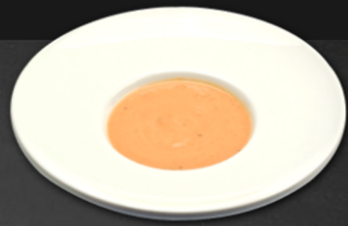
- Crème de tomates -