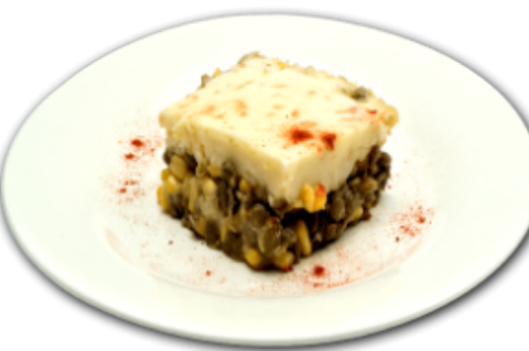
- Pâté chinois aux lentilles -