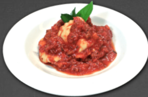
- Raviolis farcis au fromage -