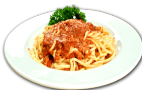
- Spaghetti à la viande -