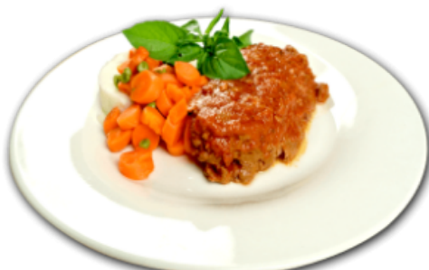
- Pain de viande -