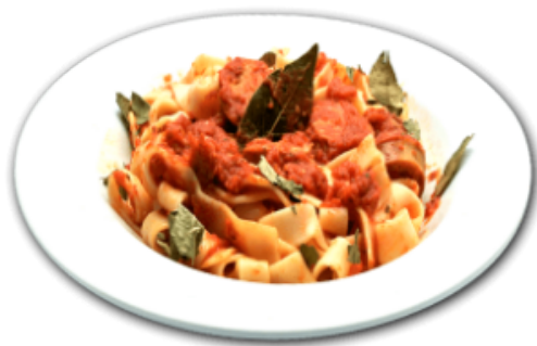
- Tajinelle aux saucisses -