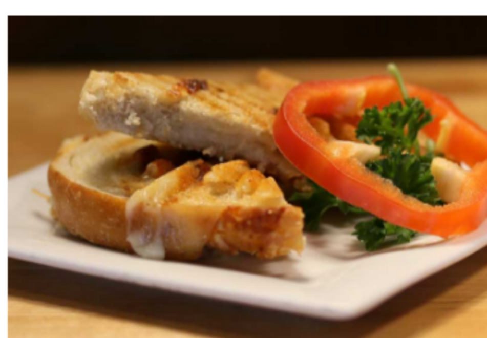
Grilled cheese Pain brun / fromage / moutarde