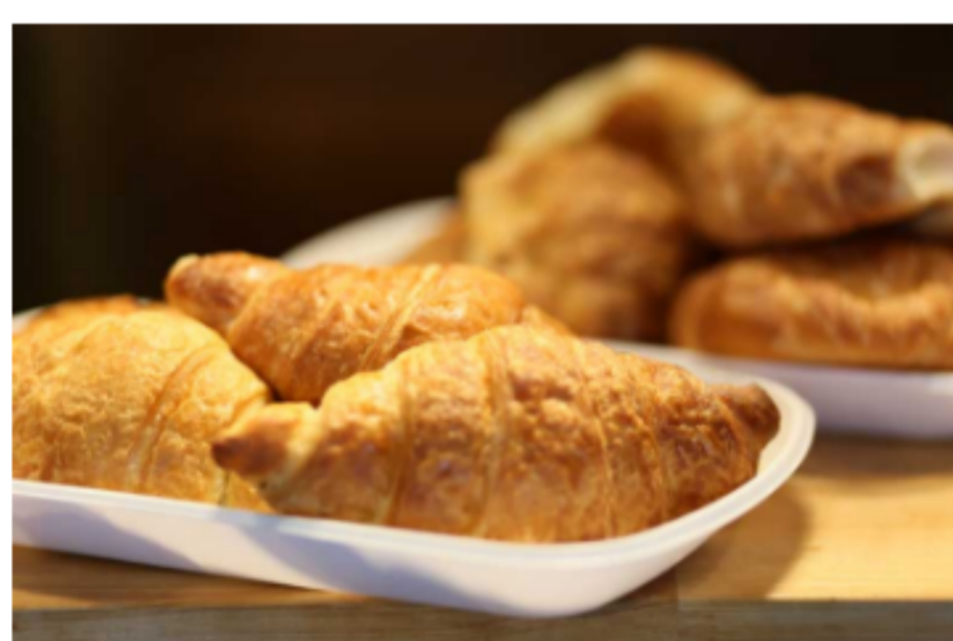
Croissants et chocolatines Frais du jour