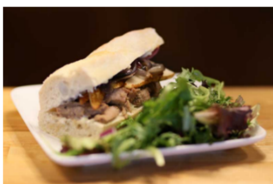
Sandwiches variés Poulet / Boeuf / Porc