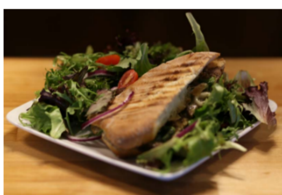
Pannini au porc effiloché Pain italien / Porc du Québec / oignon confit

LES MENUS VARIENT D'UNE SEMAINE À L'AUTRE