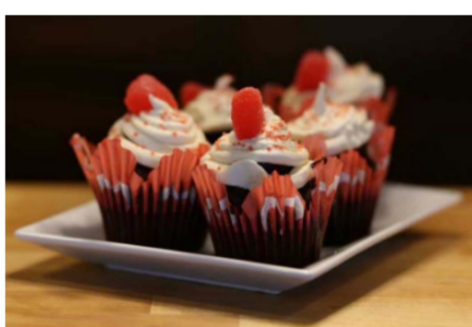
Gâteau à la framboise Chocolat / Framboise / Crème Chantilly