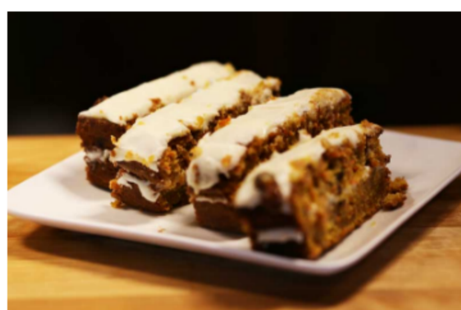
Gâteau aux carottes un dessert santé!