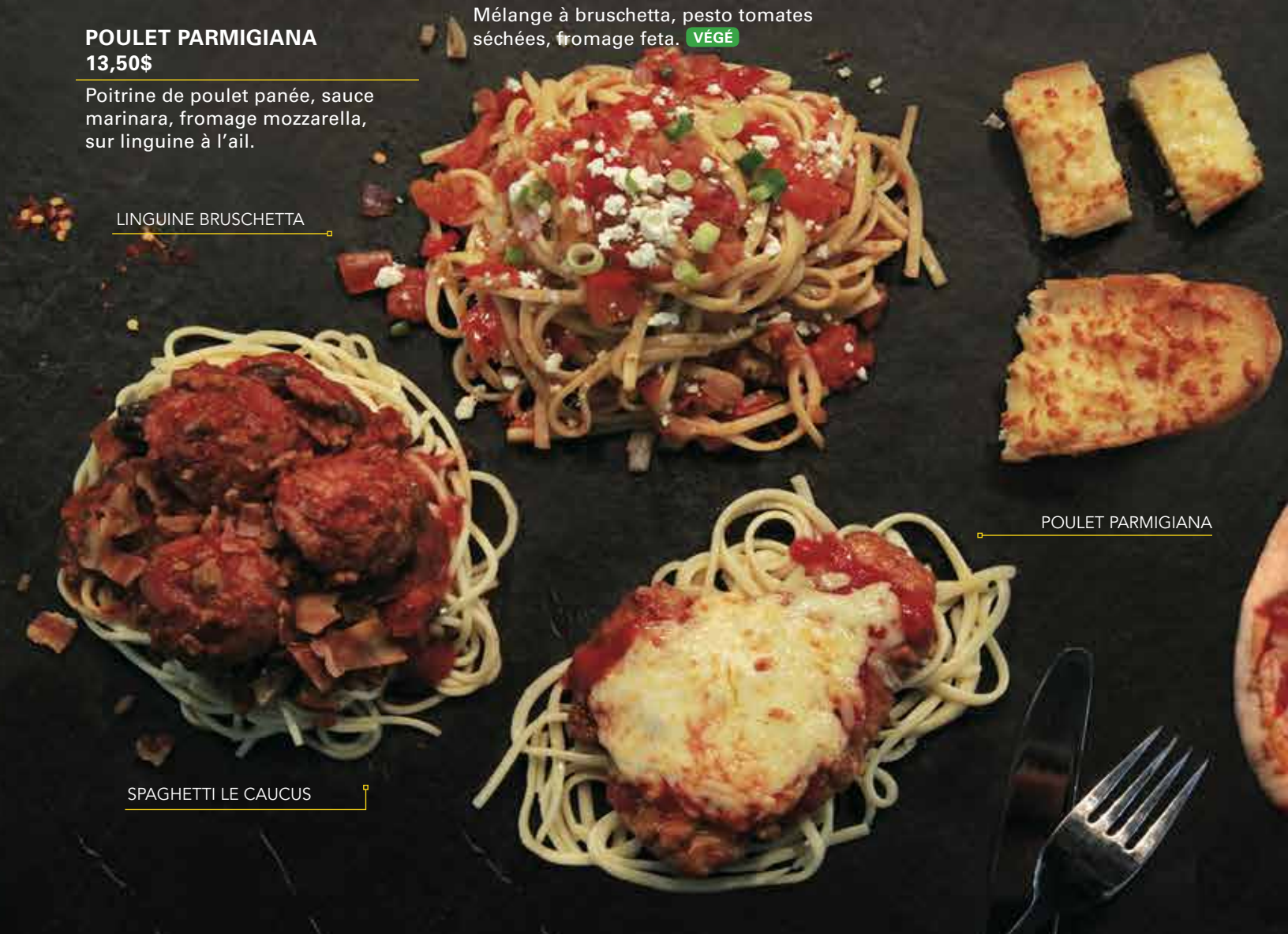
SPAGHETTI LE CAUCUS