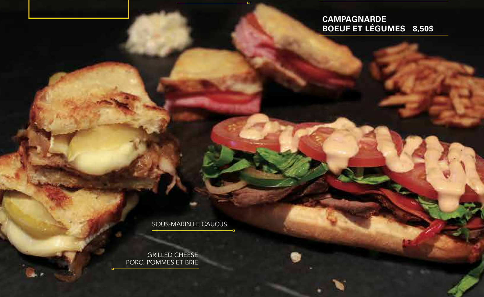
SOUS-MARIN LE CAUCUS