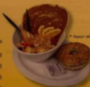
* Yogourt délice

* Nos yogourts sont disponibles en demi-portion