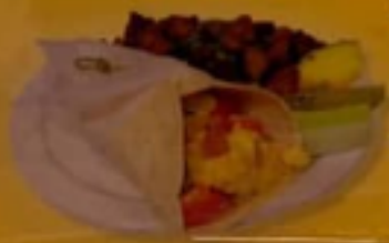
* Burrito déjuner