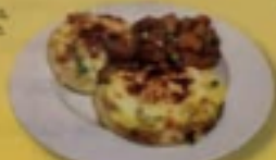
* Pizza western

Ajoutez un extra poulet déjeuner pour seulement 2,75