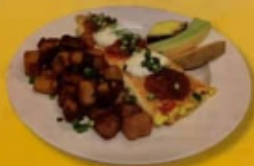
* Omelette texane

OMELETTE ATLANTIQUE 16,95 Saumon fumé, fromage à la crème, câpres et oignons rouges