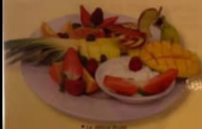
* Le délice fruité