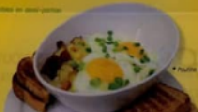
* Poutine COCODÉLICE

* Nos casseroles déjeuners sont disponibles en demi-portion