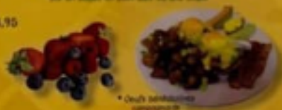
* Oeufs bénédicte campagne

* Nos oeufs bénédicte ne sont pas disponibles en accompagnement * Un muffin anglais permet des remplacements sur un œuf, un pain doré ou une omelette