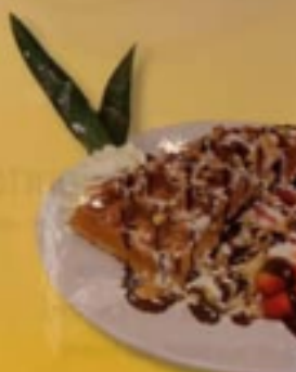
* Gaufre avec...

* Nos gaufres sont disponibles en demi-portion