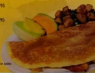
* Crêpe délice salée

* Nos crêpes salées sont disponibles en demi-portion