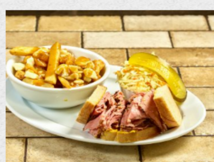
♥ Smoked meat