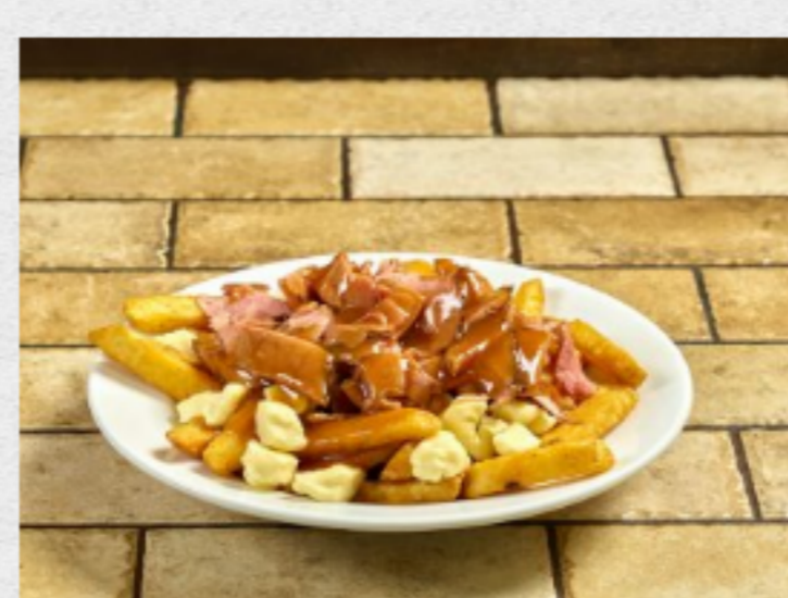
♥ Poutines & frites