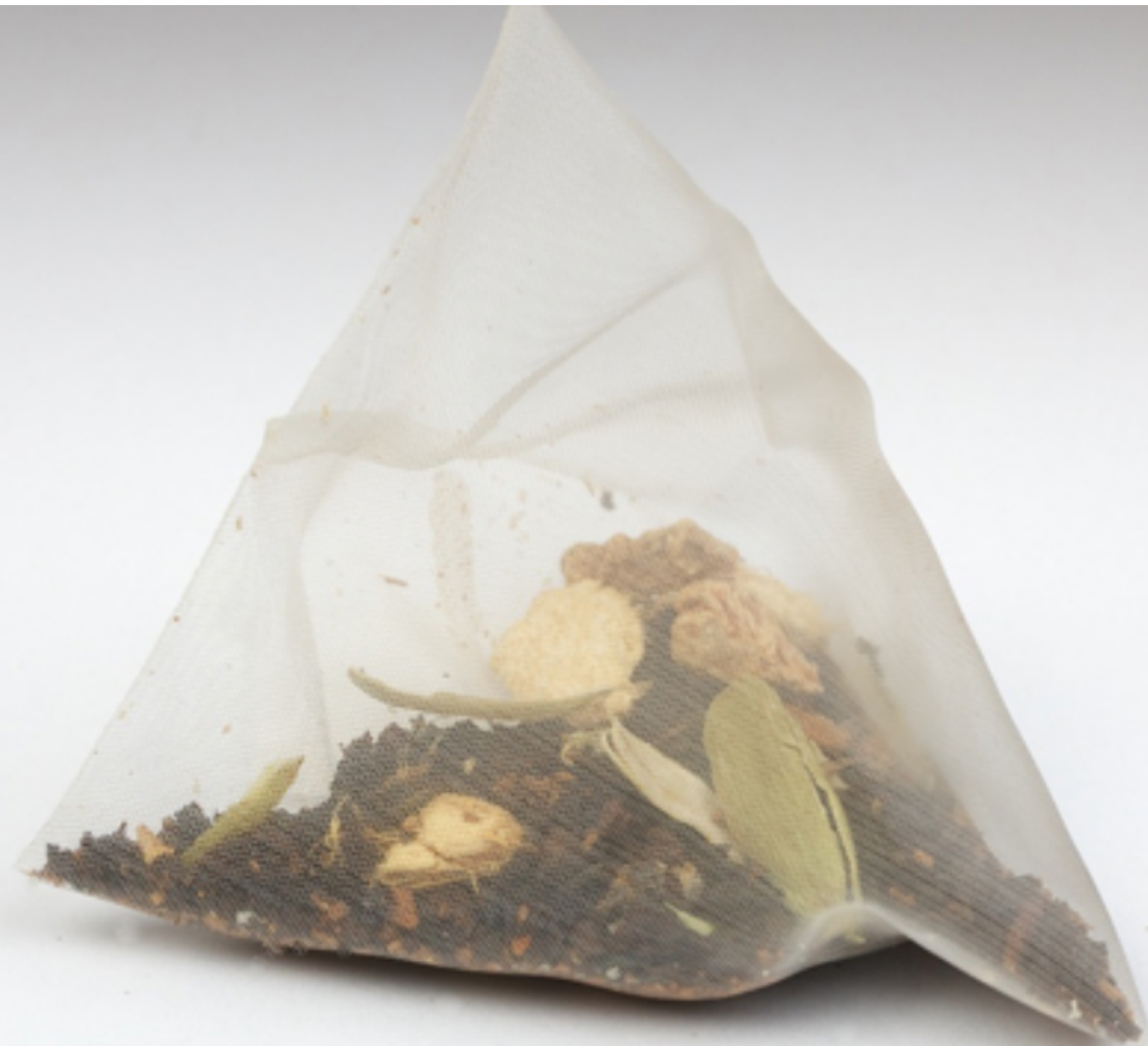
Sac de thé