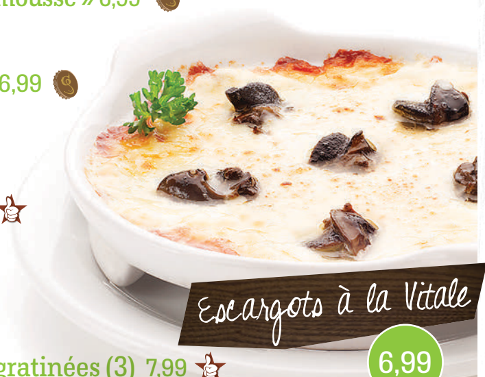
Escargots à la Vitale

(servies avec sauce BBQ Whiskey Jack Daniel's)