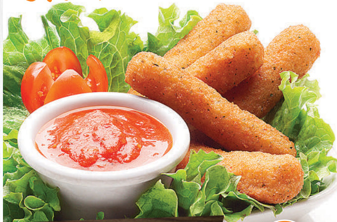
Bâtonnets de fromage