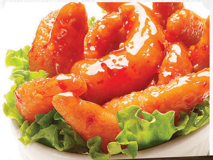
Crevettes Bang Bang