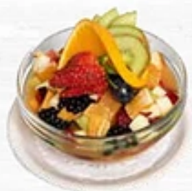
Salade de fruits frais