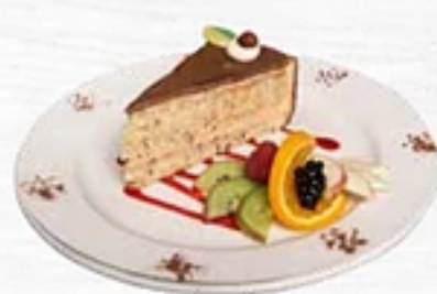
L'Or brun Noisettes et chocolat au lait