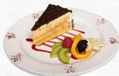
L'Orange Chocolat noir