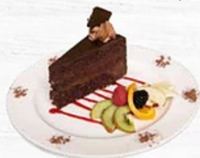
L'Extra noir Style brownie au chocolat 70 % cacao