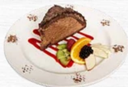
La Marquise Mousse au chocolat Valrhona