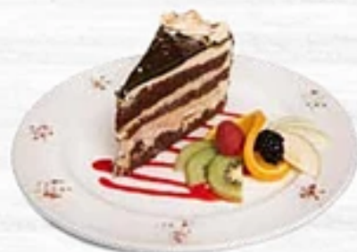
Le Piémontais Génoise au chocolat, mousseline au beurre et croquant aux amandes