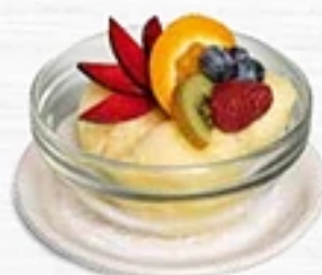
Crème glacée ou sorbet maison