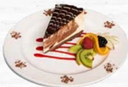
Le Fromage Marbré au chocolat