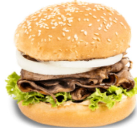
Yogi ros bif