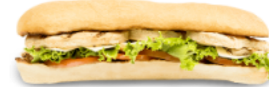
Super sous-marin au poulet