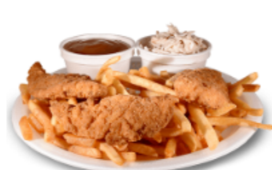
Filets de poulet