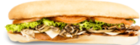
Monsieur le garde