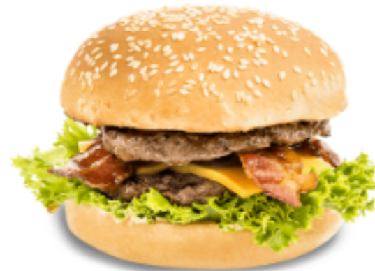
Yogi quart de livre bacon