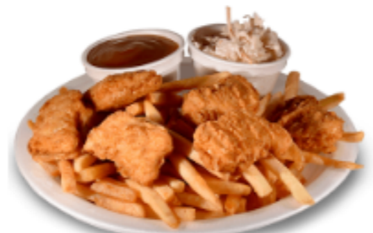
Croquettes de poulet