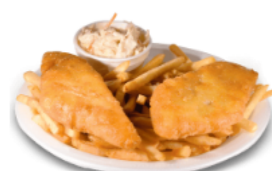
Fish et Chips