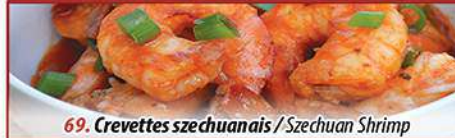
69. Crevettes szechuanais / Szechuan Shrimp