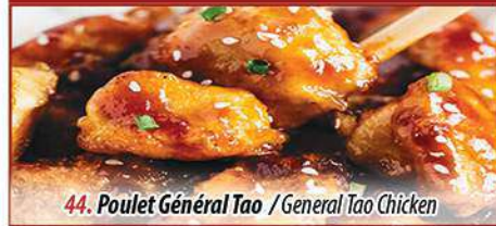
44. Poulet Général Tao / General Tao Chicken