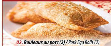
02. Rouleaux au porc (2) / Pork Egg Rolls (2)