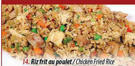
14. Riz frit au poulet / Chicken Fried Rice