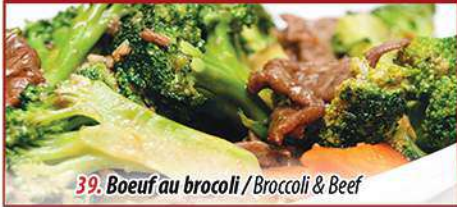
39. Boeuf au brocoli / Broccoli & Beef