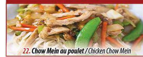
22. Chow Mein au poulet / Chicken Chow Mein