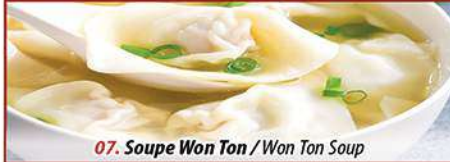
07. Soupe Won Ton / Won Ton Soup