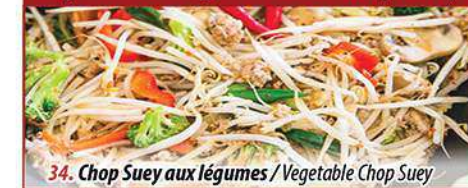
34. Chop Suey aux légumes / Vegetable Chop Suey