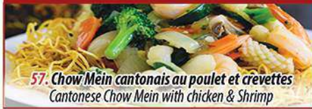
57. Chow Mein cantonnais au poulet et crevettes Cantonese Chow Mein with chicken & Shrimp