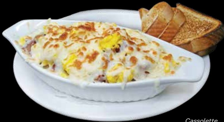
Cassolette Royal aux 4 viandes