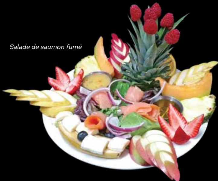
Salade de saumon fumé