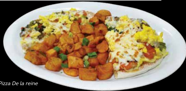
Pizza De la reine

Pizza crust, hollandaise sauce, ham, assorted peppers, onions scrambled eggs and mozzarella cheese grating