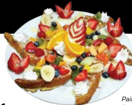
Pains dorés aux raisins, fruits et crème anglaise