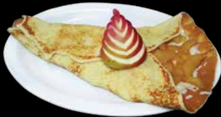
Crêpe pomme et fromage cheddar