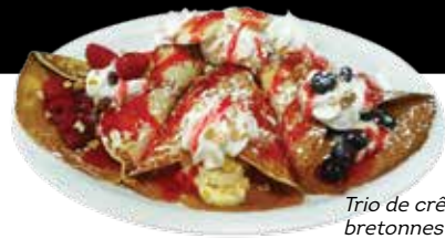
Trio de crêpes bretonnes roulées