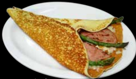
Crêpe asperges, jambon et fromage suisse