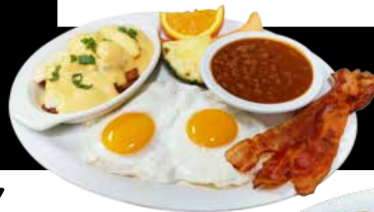
Le traditionnel avec l'extra poutine déjeuner

Remplacez vos patates déjeuner par une poutine déjeuner pour