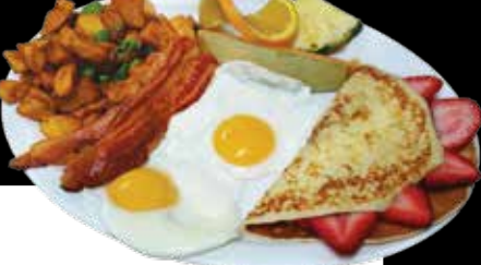
Le grand appétit