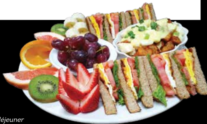
Club déjeuner avec extra poutine déjeuner

On croissant or bagel with egg, bacon, lettuce, tomatoes and american cheese.