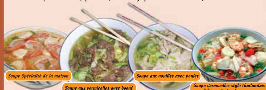
Soupe Spécialité de la maison

S9 - Soupe ToFu style Hong Kong 18.99 $ (crevettes, poulet, crabe japonais et ToFu)