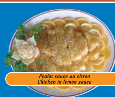
Poulet sauce au citron Chicken in lemon sauce