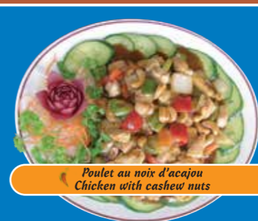
Poulet au noix d'acajou Chicken with cashew nuts